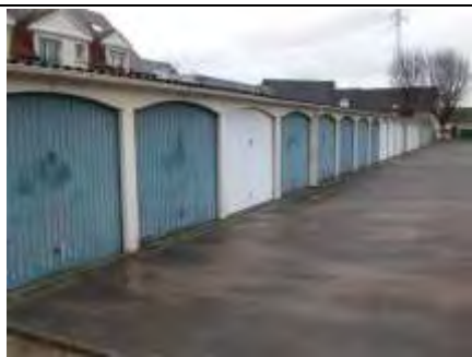
Photo n° PhA012 Localisation : Garages Ouvrage : portes garages Partie d'ouvrage : peinture portes des garages Description : peinture portes des garages ne contenant pas d'amiante après analyse Localisation sur croquis : P1 Garages